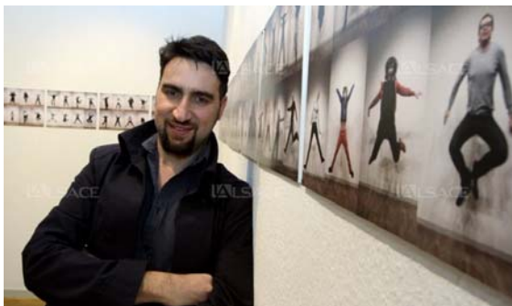
Bekir Aysan expose ses photos au Musée des beaux-arts jusqu'au 12 avril.

Hier 05:01 par Frédérique Meichler , actualisé à 18:43 Vu 18 fois